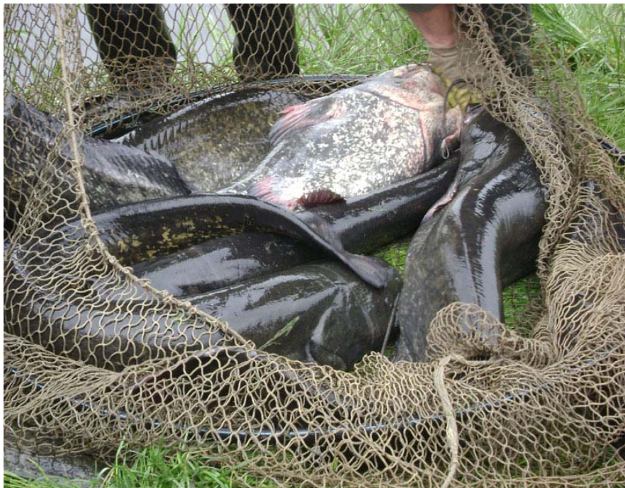
Kapitalni primjerci ulovljeni tijekom monitoringa Grabova